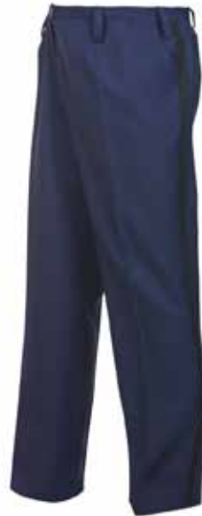
57BOA12 HEREN PANTALON zomer

2 steekzakken • 2 achterzakken • Kleur: Mood indigo en zwarte bieš • Maten: 42 t/m 64, 43 t/m 65, 22 t/m 34 • Materiaal: 55% polyester / 45% scheerwol, 320 gr./m 2