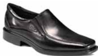
80ECCOH02 LAGE GEKLEDE HEREN INSTAPSCOEN