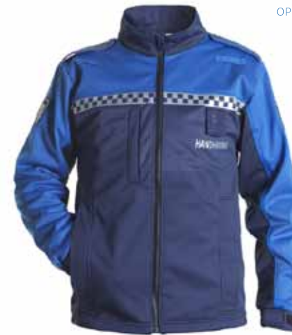
57BOA03 BOA SOFTSHELL JACK

Gebreide kraag in mood indigo met rits en kinbeschermer • 2 epauletten kleur mood indigo • 2 spreekleutellussen kleur strong blue • Bedrukte reflectiestriping in battenburgpatroon • Reflectiebedrukking 'HANDHAVING' op voor- en achterzijde • Geborduurd boa-embleem op beide mouwen • Kleur: Mood indigo / Strong blue • Maten: XXS t/m 5XL • Materiaal: Functional Fleece: 54% Biologisch katoen / 46% gerecycled polyester, 310 gr./m 2