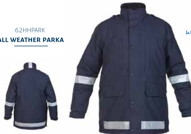
62HHPARK ALL WEATHER PARKA

Wind-, waterdicht en ademend • Uitritsbare voering met binnenzak • Uitritsbare kraag • Verdekte ritsluiting achter stormflap • Verlengd rugpand • Reflectiestriping op achterzijde kraag • 2 steekzakken met rits en klep • 1 napoleonzak met rits • 1 verticale borstzak met rits • 1 afsluitbare binnenzak • Verstelbare manchetten • 2 epauletten • Vastgestikte, unikleurige zilveren striping • Kleur: Mood indigo • Maten: XXS t/m 5XL • Materiaal: 100% polyester, PU hydrofiel laminaat