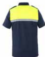
57BOA18 POLOSHIRT MET KORTE MOUWEN

2 epauletten • 2 spreekleutellussen • Bedrukte én elastische uniekleurig zilveren reflectiestriping • Geschikt voor het dragen onder een steek-/kogelwerend vest • Kleur: Mood indigo • Maten: 42 t/m 70 • Materiaal: 57% biologisch katoen / 43% gerecycled polyester, 195 gr./m 2