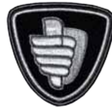
31BOABADGE GEBORDUURD BOA EMBLEEM

ook standaard verkrijgbaar met extra lange mouwen