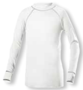
02FS01 THERMISCH ONDERSHIRT

Thermisch • Uitstekend vochttransporterend • Kleur: Wit • Maten: XS t/m 5XL • Materiaal: 50% polyester / 50% viscose, Thermal®