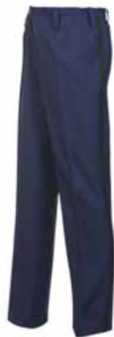
57BOA14 DAMES PANTALON zomer

2 steekzakken • 2 achterzakken • Kleur: Mood indigo en zwarte bies • Maten: 32 t/m 54 • Materiaal: 55% polyester / 45% scheerwol, 320 gr./m 2