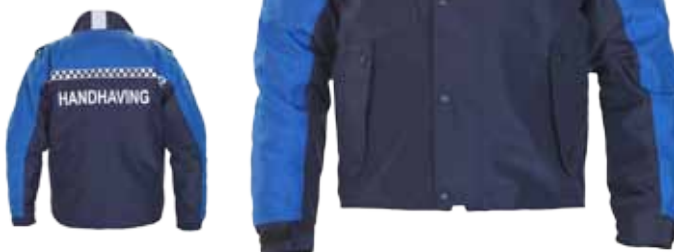
57BOA01 BOA ALL WEATHER JACK

Wind-, waterdicht en ademend volgens de normen van EN343 3-3 • Uitrustbare voering • Uitrustbare kraag • 2 steekzakken met rits en klep • 1 borstzak met rits • 1 napoleonzak met rits • 1 binnenzak • 2 epauletten • 2 spreekleutellussen • Vastgestikte reflectiestriping in battenburgpatroon • Reflectiebedrukking 'HANDHAVING' op voor- en achterzijde • Geborduurd boa-embleem op beide mouwen • 2 nestelringen t.b.v. metalen boa-insigne • Kleur: Mood indigo / Strong blue • Maten: XXS t/m 5XL • Materiaal: 100% polyester, PU laminated