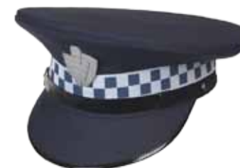
57BOA10 UNIFORM PET HEREN

Reflectiestriping in battenburgpatroon • Wordt geleverd zonder BOA-pet embleem • Kleur: Marine • Maten: 53 t/m 62 • Materiaal: 55% polyester / 45% wol