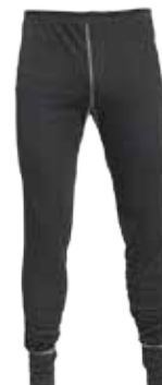
02FS02 THERMISCHE ONDERBROEK

Thermisch • Uitstekend vochttransporterend • Kleur: Zwart • Maten: XS t/m 5XL • Materiaal: 50% polyester / 50% viscose, Thermal®