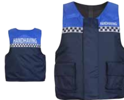
57BOA34 HOES T.B.V. EEN STEEK-/ KOGELWERENDE PANELEN

2 spreekleutellussen • Vastgestikte, uniekleurige zilveren reflectiestriping op voor- en achterpand • 2 steekzakken met klep en pennenzak • 1 napoleonzak met rits • Kleur: Mood indigo • Maten: S t/m 4XL • Materiaal: 100% polyester, PU hydrofiel laminaat