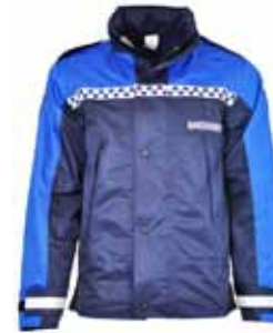
57BOA33 BOA REGENJAS

Mesh binnenvoering • Opstaande kraag met capuchon en koord • Verlengd rugpand • Capuchon • 2 epauletten • 2 spreekleutellussen • 2 zijritsen in taille • 2 binnenzakken met rits • Verstelbare mouwen met d.m.v. klittenband • 2 afsluitbare steekzakken • Wind-, waterdicht en ademend volgens EN343 3-3 • Kleur: Mood indigo / Strong blue • Maten: S t/m 4XL • Materiaal: 100% polyester (PU)