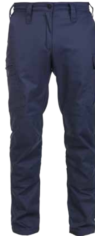
57BOA30 OPERATIONELE DAMES WORKER

2 epauletten kleur mood indigo • 2 spreekleutellussen kleur strong blue • Flat knit collar kleur mood indigo • Onderbeleg én bovenbeleg knopenlijst mood indigo • Bedrukte én elastische reflectiestriping in battenburgpatroon • Reflectiebedrukking 'HANDHAVING' op voor- en achterzijde • Geborduurd boa-embleem op beide mouwen • Geschikt voor het dragen onder een steek-/kogelwerend vest • Kleur: Mood indigo / Strong blue • Maten: 34 t/m 50 • Materiaal: Double Face: 57% biologisch katoen / 43% gerecycled polyester, 195 gr./m 2