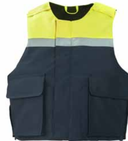
57BOA34 HOES T.B.V. EEN STEEK-/ KOGELWERENDE PANELEN

2 spreekleutellussen • Vastgestikte, unikleurige zilveren reflectiestriping op voor- en achterpand • 2 steekzakken met klep en pennenzak • 1 napoleonzak met rits • Kleur: Mood indigo • Maten: S t/m 4XL • Materiaal: 100% polyester, PU hydrofiel laminaat