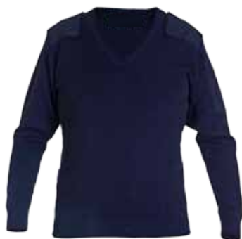
46BP01 COMMANDOTRUI MET V-HALS

Gebreide trui • 2 schouderstukken • Kleur: Navy • Maten: XS t/m 5XL • Materiaal: 50% wol / 50% Aryl