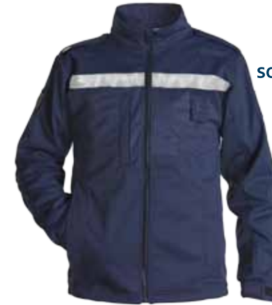
57BOA20 SOFTSHELL JACK

collectie voor toezichthouders en boa's overige domeinen