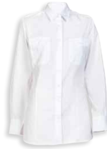
29HHDALM DAMES BLOUSE MET LANGE MOUWEN

2 epauletten • 2 borstzakken met klep • Kleur: Wit • Maten: 32 t/m 52 • Materiaal: 55% katoen / 45% polyester, 115 gr./m 2