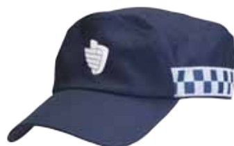
57BOA09 BOA OPERATIONELE CAP

Reflectiestriping in battenburgpatroon • 1 BOA insigne aan de voorzijde • Kleur: Mood indigo • Maten: S (51-53), M (54-56), L (57-59), XL (60-62), 2XL (63-65) • Materiaal: Katoen / polyamide / lycra met Coolmax binnenband