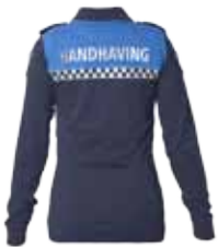
57BOA08 BOA DAMES POLOSHIRT MET LANGE MOUWEN

2 epauletten kleur mood indigo • 2 spreekleutellussen kleur strong blue • Flat knit collar kleur mood indigo • Onderbeleg én bovenbeleg knopenlijst mood indigo • Bedrukte én elastische reflectiestriping in battenburgpatroon • Reflectiebedrukking 'HANDHAVING' op voor- en achterzijde • Geborduurd boa-embleem op beide mouwen • Geschikt voor het dragen onder een steek-/kogelwerend vest • Kleur: Mood indigo / Strong blue • Maten: 34 t/m 50 • Materiaal: Double Face: 57% biologisch katoen / 43% gerecycled polyester, 195 gr./m 2