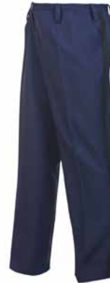
57BOA13 HEREN PANTALON winter

2 steekzakken • 2 achterzakken • Kleur: Mood indigo en zwarte bieš • Maten: 42 t/m 64, 43 t/m 65, 22 t/m 34 • Materiaal: 55% polyester / 45% scheerwol, 450 gr./m 2