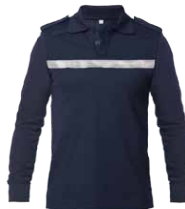
57BOA19 POLOSHIRT MET LANGE MOUWEN

2 epauletten • 2 spreekleutellussen • Bedrukte én elastische uniekleurig zilveren reflectiestriping • Geschikt voor het dragen onder een steek-/kogelwerend vest • Kleur: Mood indigo • Maten: 47 t/m 70 • Materiaal: 57% biologisch katoen / 43% gerecycled polyester, 195 gr./m 2