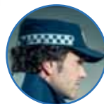
57BOA11 BOA UNIFORM HOED DAMES