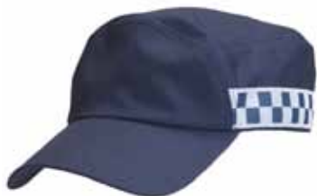
57BOA24 TZH CAP

Reflectiestriping • Kleur: Mood indigo • Maten: S (51-53), M (54-56), L (57-59), XL (60-62), 2XL (63-65) • Materiaal: katoen, polyamide, lycra met Coolmax binnenband