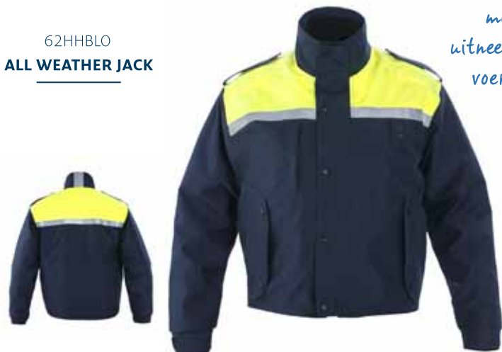
62HHBLO ALL WEATHER JACK

Wind-, waterdicht en ademend • Uitritsbare voering met binnenzak • Uitritsbare kraag • Ritsen aan de zijkant zodat koppelriem eenvoudig te bereiken is • Verdekte ritsluiting achter stormflap • Reflectiestriping op achterzijde kraag • 2 steekzakken met rits • 2 voorzakken met klep • 1 napoleonzak met rits • 2 verticale borstzakken met rits • 1 afsluitbare binnenzak • 2 epauletten • Vastgestikte, unikleurige zilveren striping • Kleur: Mood indigo • Maten: XXS t/m 5XL • Materiaal: 100% polyester, PU hydrofiel laminaat