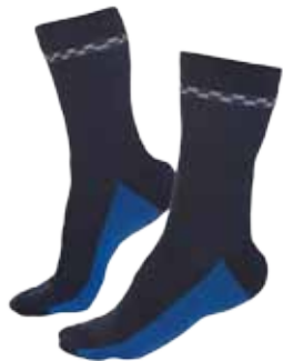
57BOA16 BOA SOKKEN

Representatieve werksok • Maten: 35-38, 39-42, 43-46, 47-50 • Kleur: Mood indigo / Strong blue • Materiaal: 80% katoen / 18% polyamide / 2% elastaan