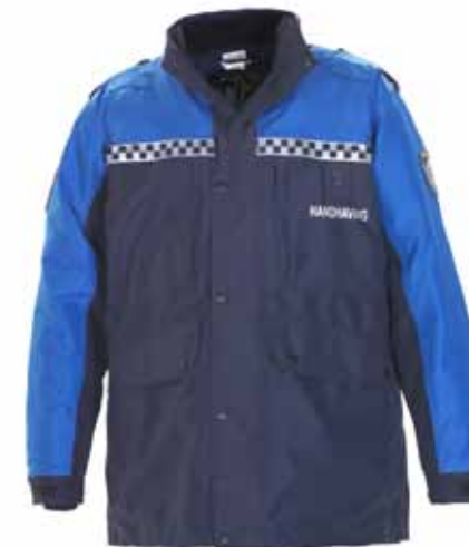
57BOA02 BOA ALL WEATHER PARKA

Wind-, waterdicht en ademend volgens de normen van EN343 3-3 • Uitrustbare voering • Uitrustbare kraag • 2 steekzakken met rits en klep • 1 borstzak met rits • 1 napoleonzak met rits • 1 binnenzak • 2 epauletten • 2 spreekleutellussen • Vastgestikte reflectiestriping in battenburgpatroon • Reflectiebedrukking 'HANDHAVING' op voor- en achterzijde • Geborduurd boa-embleem op beide mouwen • 2 nestelringen t.b.v. metalen boa-insigne • Kleur: Mood indigo / Strong blue • Maten: XXS t/m 5XL • Materiaal: 100% polyester, PU laminated