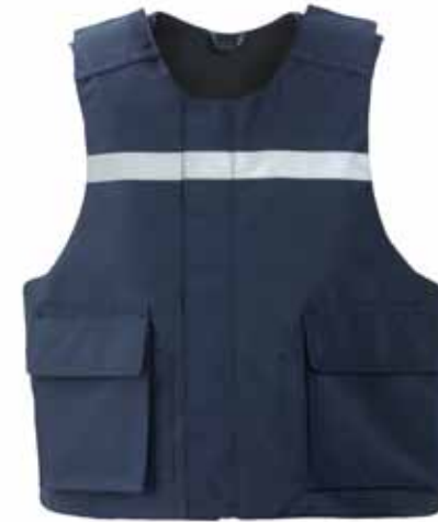
57BOA34 HOES T.B.V. EEN STEEK-/ KOGELWERENDE PANELEN