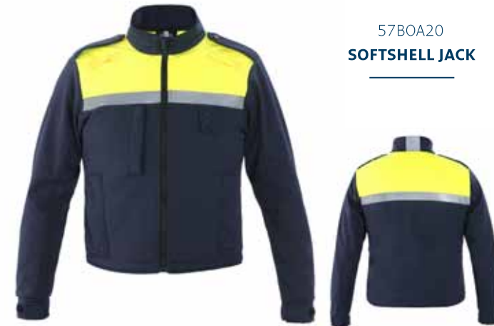
57BOA20 SOFTSHELL JACK