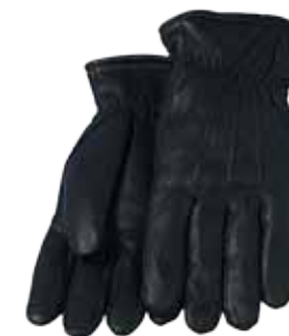
31SPE17 UNIFORM HANDSCHOEN

Thinsulate™ voering • Kleur: Zwart • Maten: XS t/m 3XL • Materiaal: Lamsleder