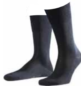
05AC10 COOLMAX SOKKEN

Optimale vochtregulerende eigenschappen houden de voeten fris en fit • Maten: 35-38, 39-42, 43-46, 47-50 • Kleur: Zwart, navy • Materiaal: 50% Coolmax® / 25% katoen / 20% polyamide / 5% elastane