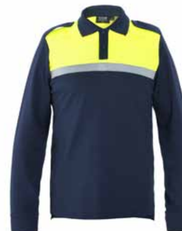
57BOA19 POLOSHIRT MET LANGE MOUWEN

2 epauletten • 2 spreekleutellussen • Bedrukte én elastische uniekleurig zilveren reflectiestriping • Geschikt voor het dragen onder een steek-/kogelwerend vest • Kleur: Mood indigo / fluor geel • Maten: 42 t/m 66 • Materiaal: 57% katoen / 43% polyester, 195 gr./m 2